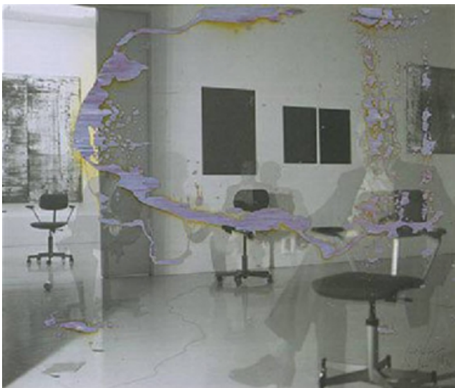
Gerhard Richter, 26. Jan. 1990 50,8 cm x 60 cm Öl auf Schwarz-Weiß-Fotografie © Gerhard Richter 2023 (25042023)

Montag, 15.05.2023, 18:00 Uhr August-Bebel-Straße 20, Hörsaal E08 (ABS/E08/H)